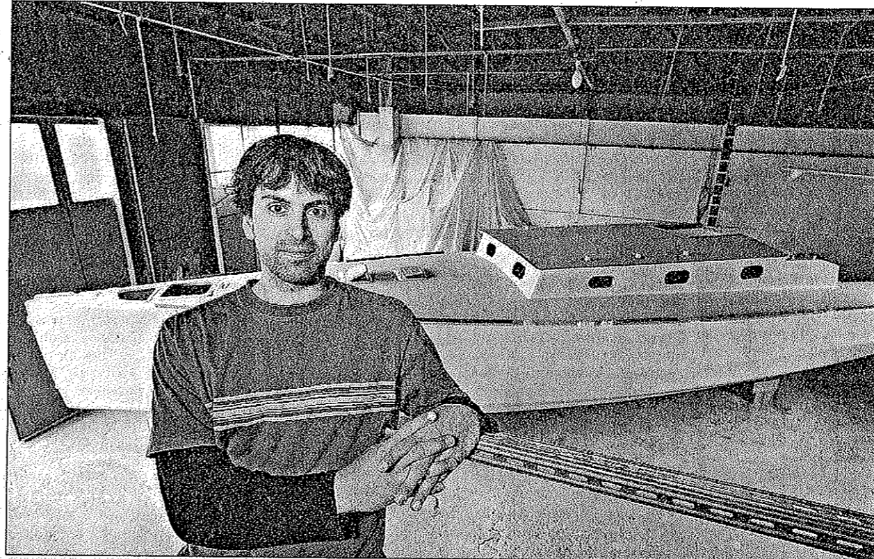
Le quillard sera équipé d'un mât de 16 mètres, auquel seront fixés les 100 m 2 de voiles qui propulseront le bateau de 6 tonnes